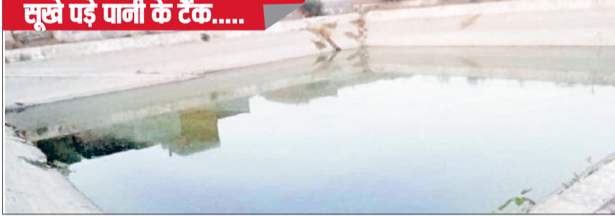
सूखे पड़े पानी के टैंक.....