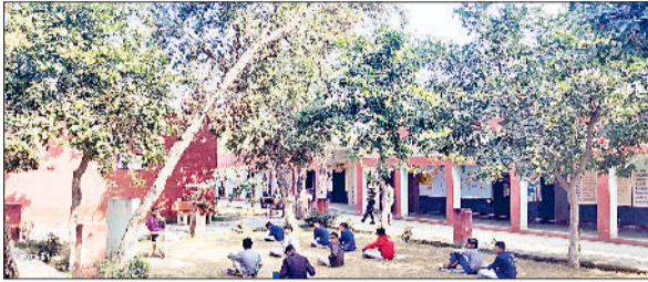
अलेवा। राजकीय संस्कृति माडल वमावि में सूखे पेड़ के नीचे बैठकर पढ़ते बच्चे।

हैं। पेड़ झुके होने के अलावा उनकी हालत इतनी खराब है कि वह कभी गिर कर बच्चों को चोटिल कर सकते हैं। गांव के लोग मामले की सूचना अनेक बार शिक्षा विभाग के अधिकारियों को दे चुके हैं लेकिन