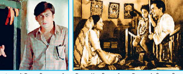
श्याम बेनेगल की 'अंकुर' में दिखा जीवन यथार्थ