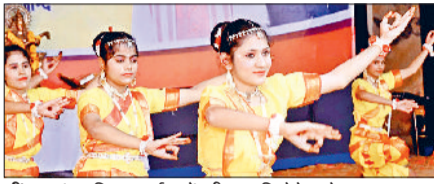
जीद। सांस्कृतिक कार्यक्रमों की प्रस्तुति देते बच्चे।