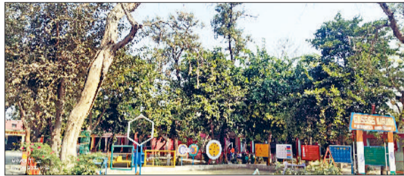
अलेवा। राजकीय संस्कृति माडल वमावि में हादसों को न्योता देता सूखा पेड़।

हैं। पेड़ झुके होने के अलावा उनकी हालत इतनी खराब है कि वह कभी गिर कर बच्चों को चोटिल कर सकते हैं। गांव के लोग मामले की सूचना अनेक बार शिक्षा विभाग के अधिकारियों को दे चुके हैं लेकिन