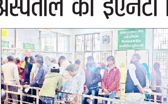
जाँद। नागरिक अस्पताल में दवा के लिए लगी लाइन।